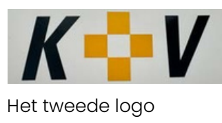
Het tweede logo