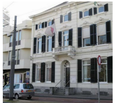
In Arnhem verhuizen we naar het Velperplein.